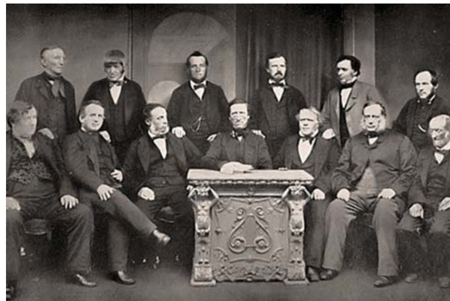
Fundadores de Rochdale Society of Equitable (1844)

La cooperativa trabaja para el desarrollo sostenible de su comunidad por medio de políticas aceptadas por sus socios. Al mismo tiempo que se centran en las necesidades y los deseos de los socios, las cooperativas trabajan para conseguir el desarrollo sostenible de las comunidades, según los criterios aprobados por los socios.